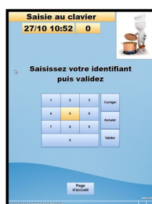
1 - Écran de passage