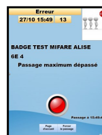
4 - Passage NON OK (voyant rouge et motif du refus : solde insuffisant dans l'exemple)