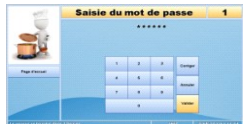
2 - En cas d'oubli de carte, le convive saisit sur l'écran identifiant et mot de passe