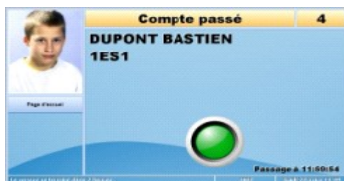
3 - Passage OK (voyant vert)