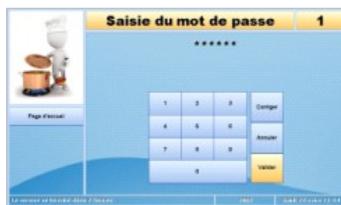
2 - En cas d'oubli de carte, le convive saisit sur l'écran identifiant et mot de passe