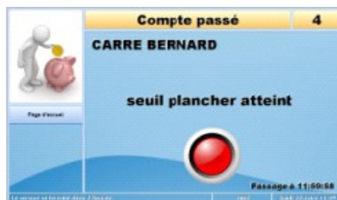
4 - Passage NON OK (voyant rouge et motif de refus : solde insuffisant dans l'exemple)