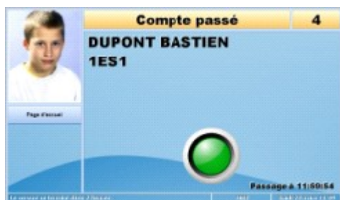
3 - Passage OK (voyant vert)