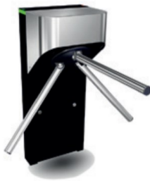
Modèle TL1-Pied Acier