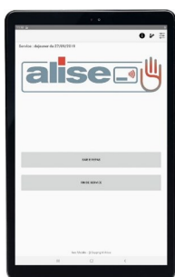
Tablette ANDROID (exemple Galaxy Tab A 10'')